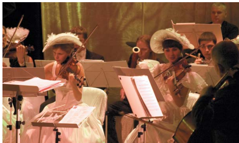
Białolecka Orkiestra Romantica w I cz. Koncertu Wielkie Gwiazdy są wśród nas

Artystom towarzyszyć będzie Białolecka Orkiestra „Romantica”, która debiutowała przed naszą publicznością równo rok temu, a od tego czasu odniosła wiele sukcesów artystycznych, rozslawiając Białolekę w kraju i zagranicą.