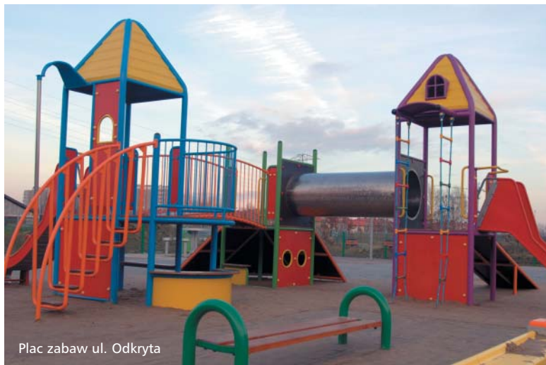
Plac zabaw ul. Odkryta

Trwa II etap budowy placów zabaw i Skateparku. Place zabaw są ogradzane