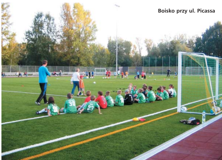
Boisko przy ul. Picassa

Dzięki inwestycjom zrealizowanym przez dzielnicę i miasto Białoleka zmienia się nie do poznania. DN, BWN