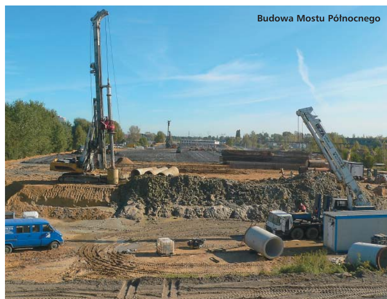
Budowa Mostu Północnego

Jako młoda duchem i ciałem – prawie połowa mieszkańców Białoleki to dzieci i młodzież –