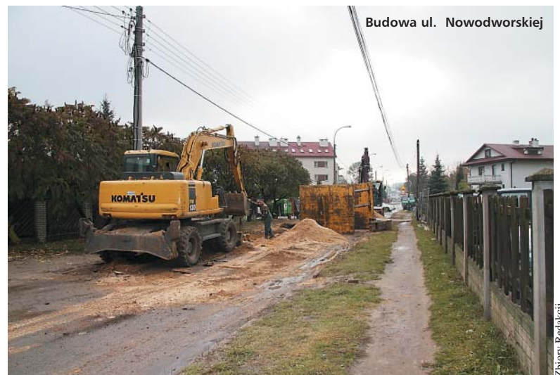
Budowa ul. Nowodworskiej

Na wspieranie działań w zakresie kultury dzielnica wyda ok. 8 mln zł. Suma ta przerna-