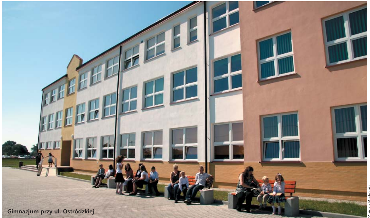
Gimnazjum przy ul. Ostródzkiej

zostało 11 milionów przeznaczonych zostanie na inwestycje. W 2010 r. zakończone zostaną prace przy budowie ulic Nowodworskiej i Odkrytej oraz modernizacja układu komunikacyjnego Ruskowy Bród – Zdziarska – Berensona. Przewidziane jest również zakończenie budowy ronda Małej Brzozy przy ul. Głębockiej, o którym piszemy w tym numerze „Czasu Białoleki”. Inną ważną inwestycją dla Białoleki, która pochłonie w tym roku 400 tys. zł jest budowa nowych ścieżek rowerowych.