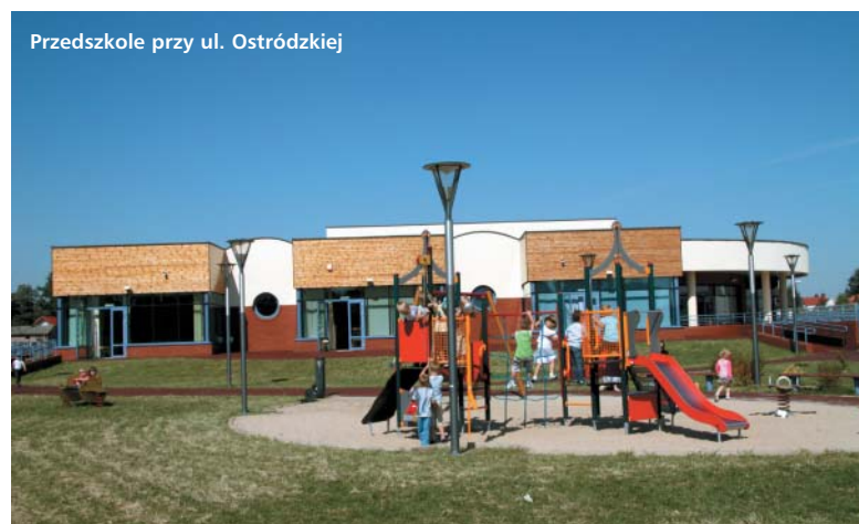
Przedszkole przy ul. Ostródzkiej