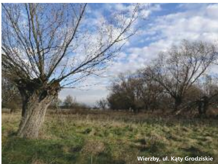
Wierzby, ul. Kąty Grodzkie