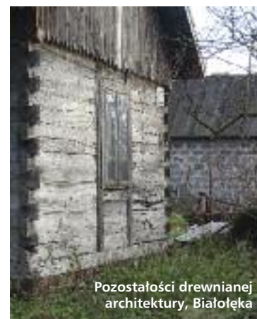
Pozostałości drewnianej architektury, Białoleka