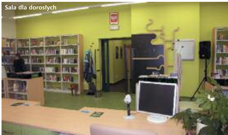
Sala dla dorosłych