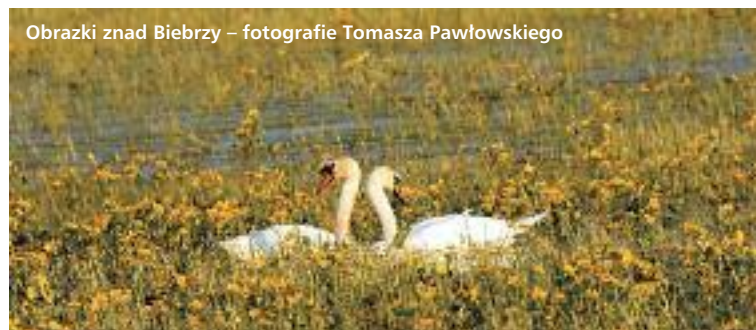
Obrazki znad Biebrzy – fotografie Tomasza Pawłowskiego

„ŚWIĘTOJANKI” – pokazy sekcji BOK Wstęp wolny