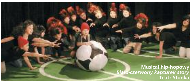
Musical hip-hopowy Biało-czerwony kapturek story Teatr Stonka

wiekszą liczbę królewskich pieczęci. Kto zdobędzie nagrodę? Uwaga, dzieci! Nie zapomnijcie zabrać ze sobą podpisanych „Królewskich dzienniczków”. Koniecznie przebijcie się w pomyslowe kostiumy. – Na zakończenie Królowa Muzyki wybierze Królową i Króla Balu! Ten ekscytujący spektakl muzyczny przygotowała dla was reżyser Ewa Szawlowska.