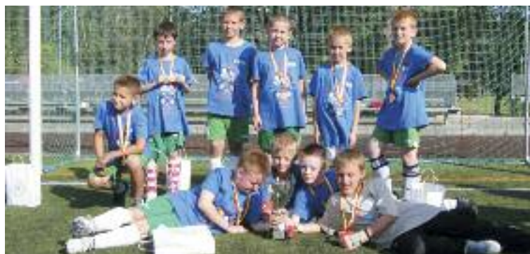
Triumfatorzy mistrzostw – Italia