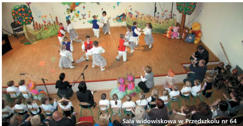
Sala widowiskowa w Przedszkolu nr 64