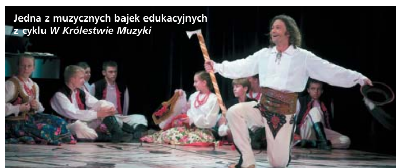
Jedna z muzycznych bajek edukacyjnych z cyklu W Królestwie Muzyki