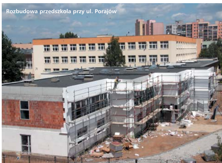
Rozbudowa przedszkola przy ul. Porajów

Wschodnie tereny dzielnicy, do niedawna mało zaludnione, teraz rozwijają się dynamicznie. Tam właśnie powstaje najwięcej nowych osiedli, a wraz z nimi przybywa dzieci. Tereny te były dotychczas niedoinwestowane w zakresie oświaty, dlatego zdecydowano o rozbudowie szkoły przy ul. Juranda ze Spychowa. Rok temu władze Białołęki pozyskały na ten cel dodatkowe 5 mln zł. Projekt rozbudowy był przygotowany wcześniej, więc inwestycję można było rozpocząć