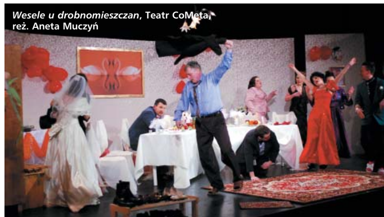
Wesele u drobniomieszczan, Teatr CoMeta, reż. Aneta Muczyń

ry? – Trudno będzie ustalić. Drugi dramat – „Serenada”, opowiada historię trzech kur, koguta i lisa. Zwierzęce postaci, jak te w bajkach La Fontaine’a, posiadają cechy ludzkie... W mistrzowskich dialogach odnajdziemy sporą dawkę cierpkiego humoru, ale