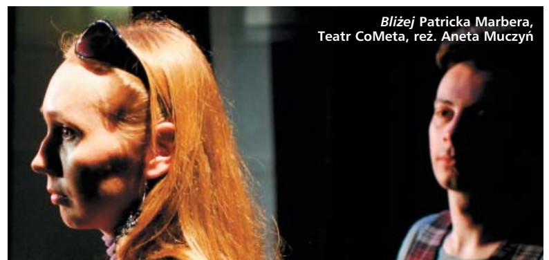
Blżej Patricka Marbera, Teatr CoMeta, reż. Aneta Muczyń

„A ja coś mam” według scenariusza Zofii Wójcik Teatr Stoneczka reż. Katarzyna Kryczka wstęp wolny