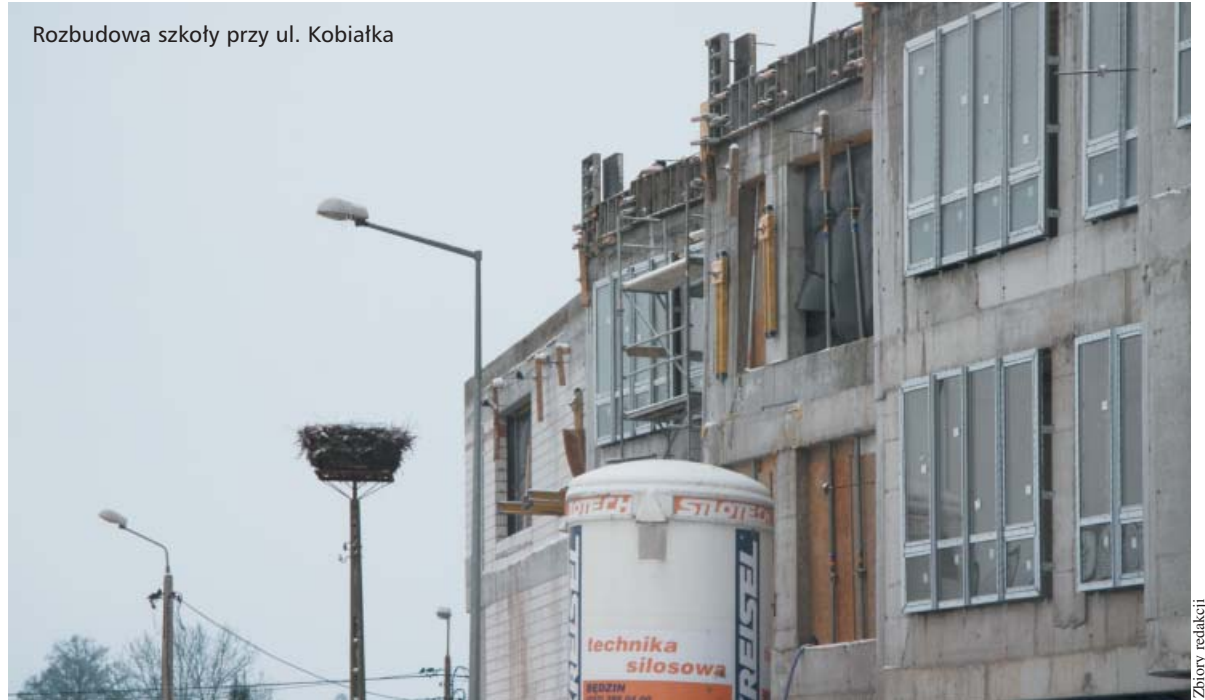
Rozbudowa szkoły przy ul. Kobiątka

mieli wszystkie nowoczesne placówki, z bazą sportowo-rekreacyjną. Mogę zapewnić, że oświata jest najważniejszym zadaniem, które w tej chwili stoi przed nami i zrobimy wszystko, żeby nasze dzieci miały jak najlepsze warunki zdobywania wiedzy. Tego mogę życzyć nie tylko mieszkańcom, ale również pracownikom oświaty w Białołęce.