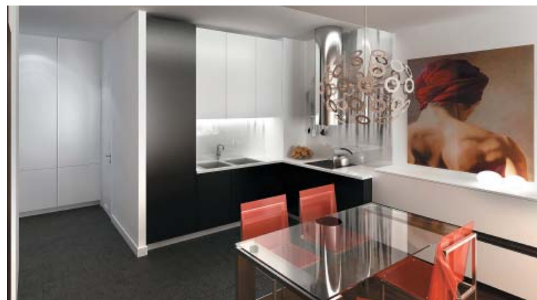
Warsaw Trust Development