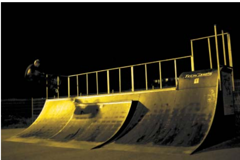
Izabela Szeligowska – Skatepark Białoleka nocna jazda na desce – 3 miejsce