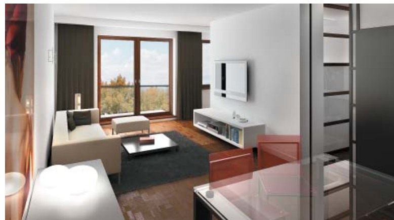
Warsaw Trust Development