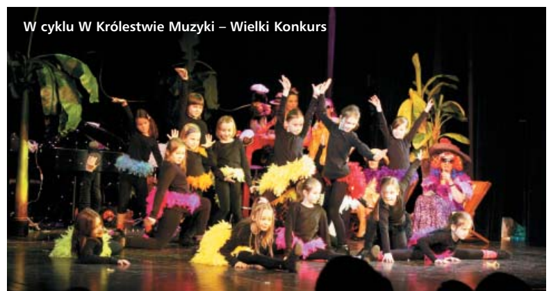
W cyklu W Królestwie Muzyki – Wielki Konkurs

Świąt wypełnionych radością i miłością, niosących spokój i odpoczynek, spełnienia wszelkich marzeń, pełnego optymizmu, wiary, szczęścia i powodzenia Nowego Roku 2011 – życzy dyrektor i pracownicy BOK.