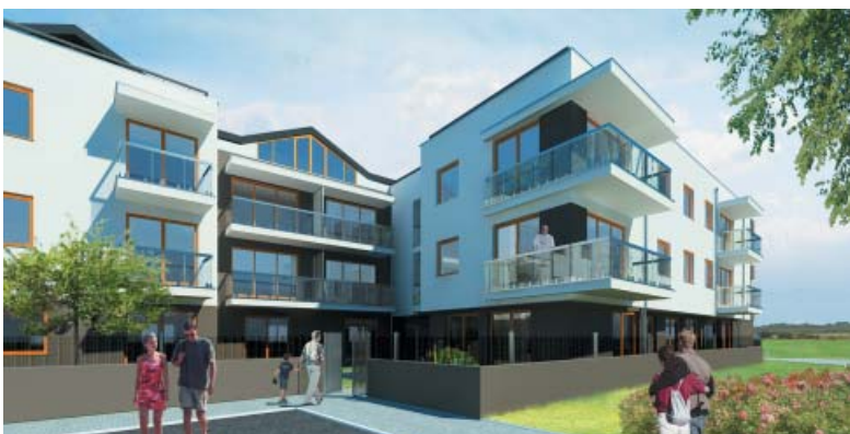
Warsaw Trust Development

Niewątpliwym atutem lokalizacji jest budowany Most Północny oraz Szybki Tramwaj, który umożliwi Państwu szybkie dotarcie do centrum Warszawy.