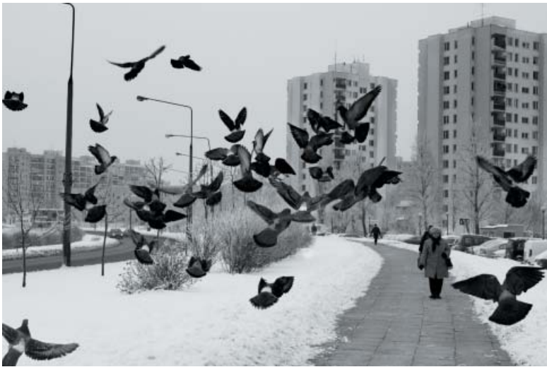
Norbert Konarzewski – Skrzydłaci mieszkańcy – 1 miejsce