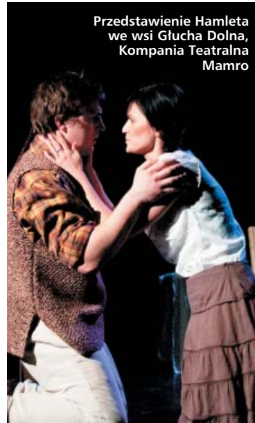
Przedstawienie Hamleta we wsi Głucha Dolna, Kompania Teatralna Mamro

Z końcem miesiąca nadejdzie czas premier. Teatr KLIMT przygotował montaż najślynniejszych utworów