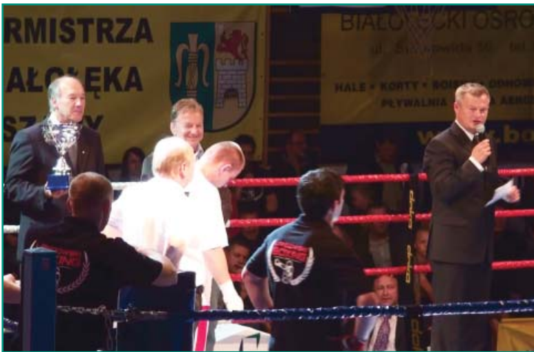
Rzut monetą zdecydował o zwycięstwie