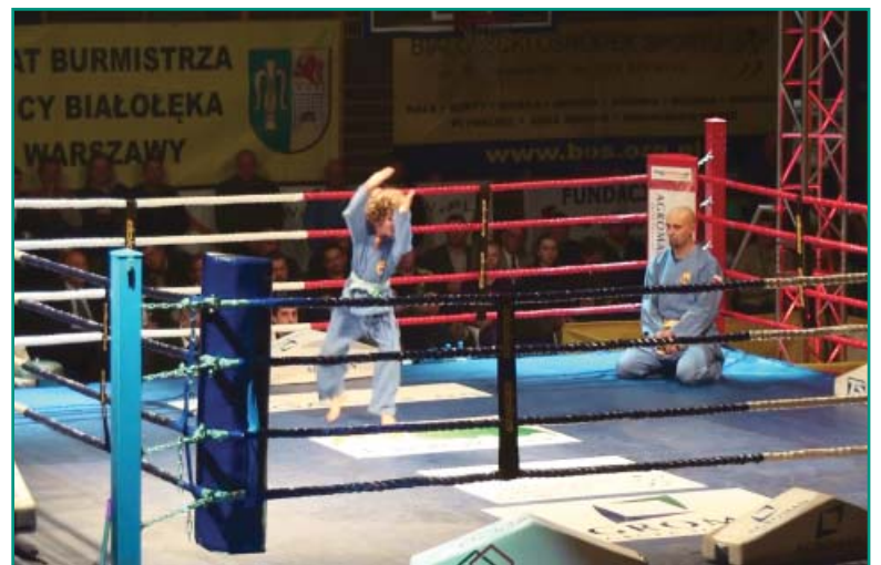
...oraz pokazy VOVINAM VIET VO DAO

Za pomoc w organizacji Białołęckiej Gali Boksu szczególnie dziękujemy firmom: AGROMAN, TELCOMP SERVICE, GIGA Sp. z o.o., TOI TOI POLSKA oraz Fundacji SOS dla boksu amatorskiego w Polsce.