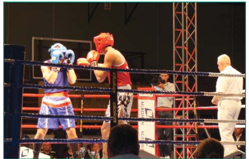
... tuż przed nokautem