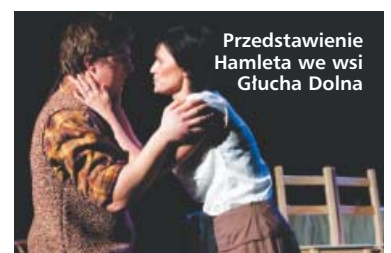
Przedstawienie Hamleta we wsi Głucha Dolna