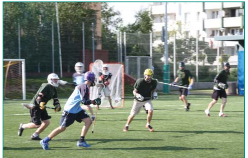
„Najszybsza gra na dwóch nogach” – lacrosse

Dziękujemy Sponsorom za pomoc w organizacji pikniku rodzinnego w dniu 29 maja 2010 r.