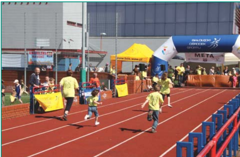
Rodzinne zawody biegowe