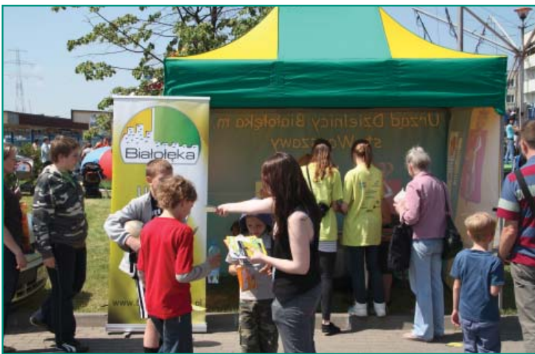
Stoisko Urzędu Dzielnicy Białoleka