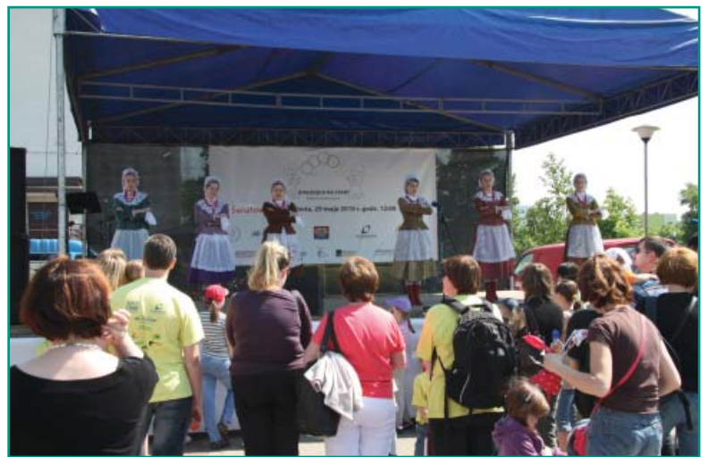
Śpiewy, tańce i akrobacje – występy na scenie