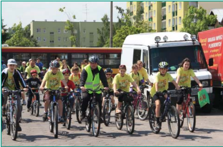
X Rodzinny Piknik Rowerowy