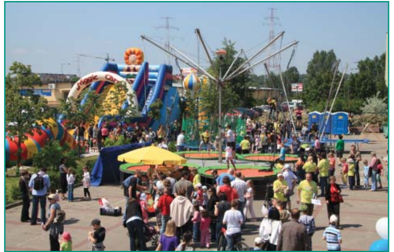
Strefa najmłodszych – trampoliny, zjeżdżalnie, wata cukrowa