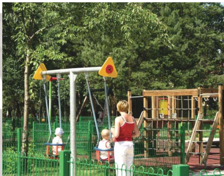
Plac zabaw ul. Brzezińska.