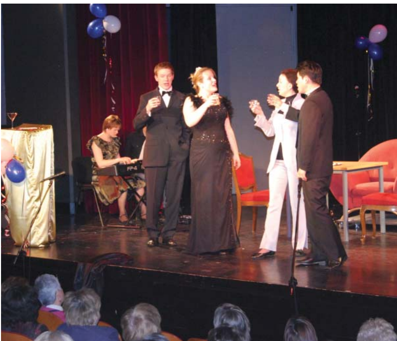
Na balu u Księcia Orłowskiego, czyli przeboje operowe i operetkowe z humorem