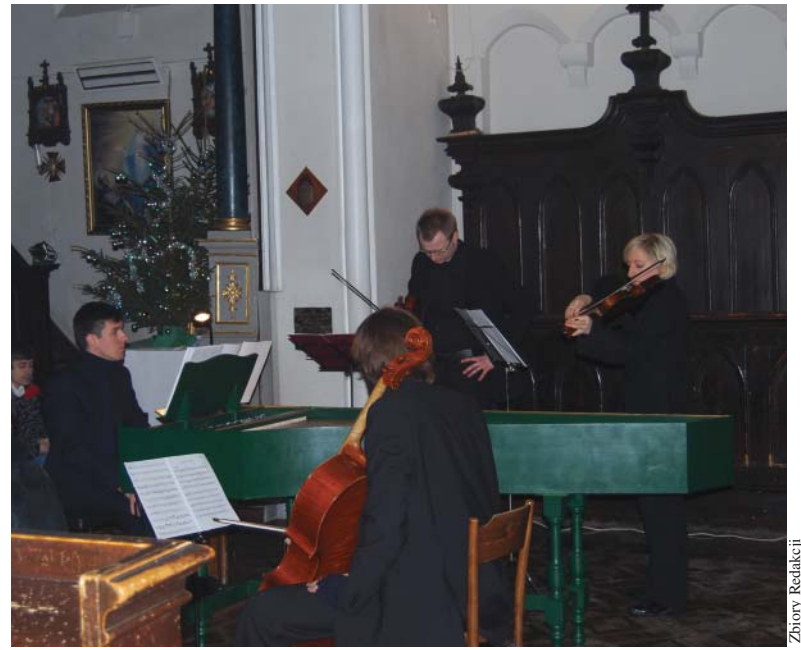
Muzyka europejskiego baroku

12 lutego wieczorem w Białolece ponownie zagościła opera i operetka. Jednak tym razem z humorem w wykonaniu artystów z pasją czyli „Passion Artists” z Wiednia. Spektakl „Na balu u księcia Orłowskiego” oparty był na historii