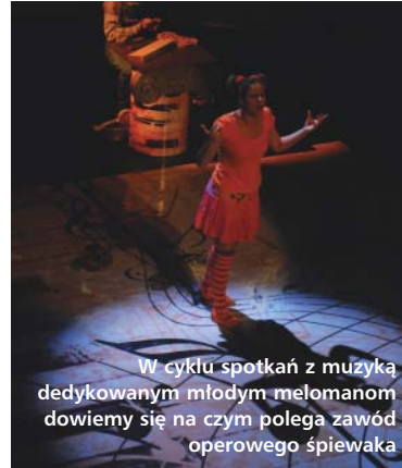
W cyklu spotkań z muzyką dedykowanym młodym melomanom dowiemy się na czym polega zawód operowego śpiewaka

Od 26 lutego do 7 marca nasza dzielnica będzie obchodziła swoje święto. Zwieńczeniem obchodów IV już Dni Białoleki, zorganizowanych przez BOK oraz działające przy jego Radzie Programowej organizacje pozarządowe, będzie koncert orkiestry Romantica. Przedtem jednak będzie można wziąć udział w uroczystości upamiętniającej zwycięską bitwę pod Białoleką lub w deblowym turnieju tenisa stołowego czy spróbować sił w zespołowej grze miejskiej „Po SKARB dla BIAŁOLEKI”. Do udziału w grze miejskiej mogą się zgłaszać drużyny 4-5-osobowe. Do 1 marca obowiązuje wstępna rejestracja drużyn. Na zwycięzców czekają nagrody. Regulamin gry znajdą Państwo na stronie internetowej www.bok.waw.pl .