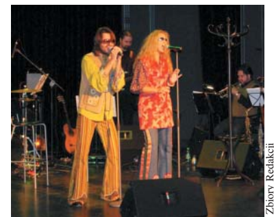
Koncert z cyklu Malarze słowa – Niemen