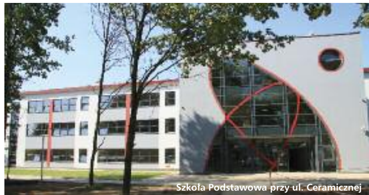
Szkoła Podstawowa przy ul. Ceramicznej

O szkole przy ul. Głębockiej piszemy więc na pierwszej stronie.