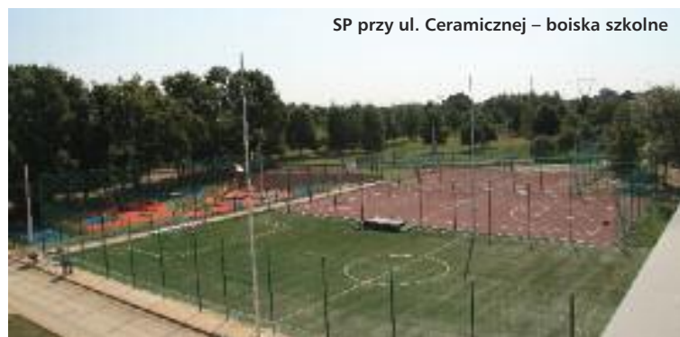
SP przy ul. Ceramicznej – boiska szkolne