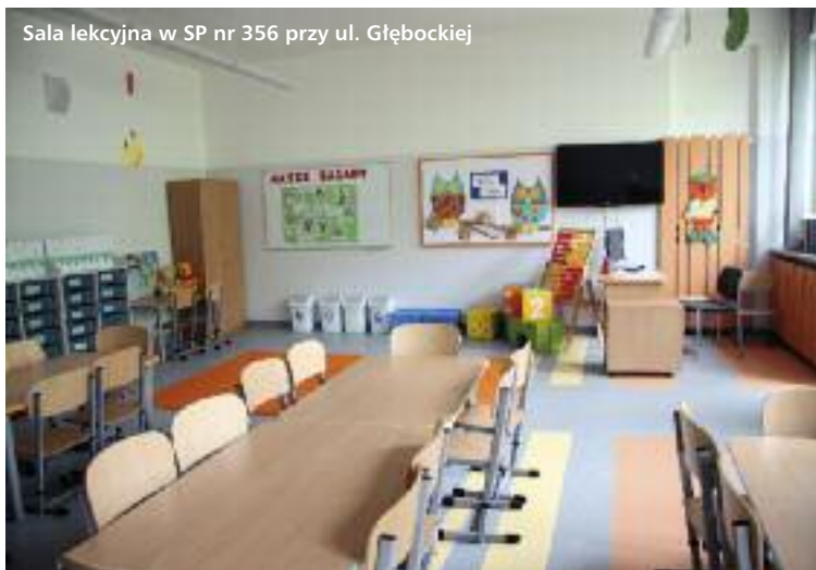
Sala lekcyjna w SP nr 356 przy ul. Głębockiej