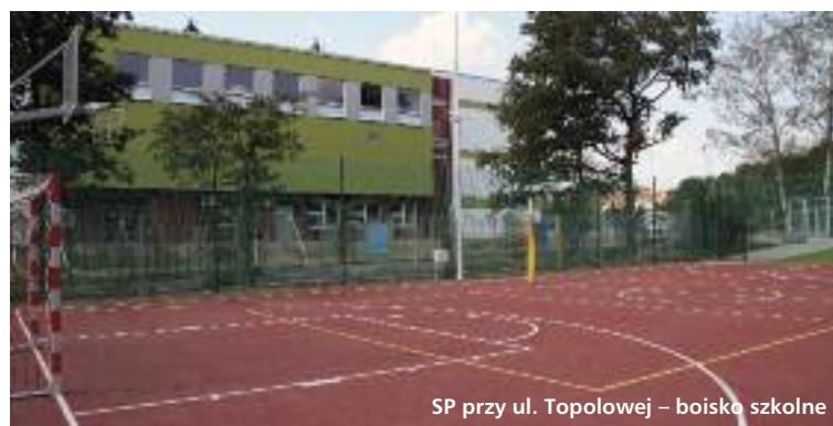
SP przy ul. Topolowej – boiska szkolne