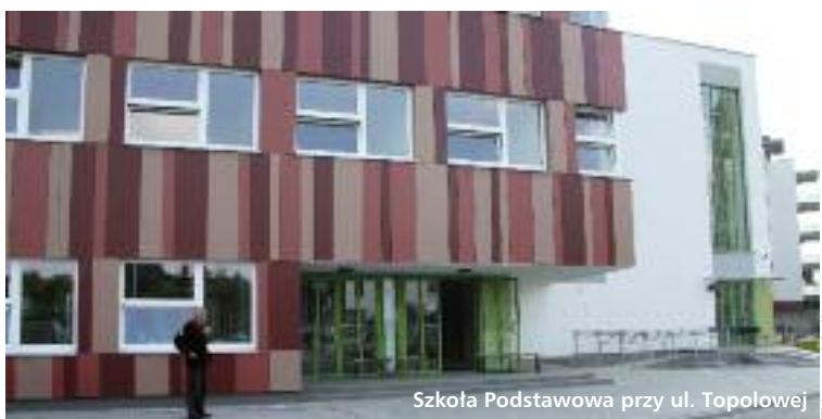
Szkoła Podstawowa przy ul. Topolowej