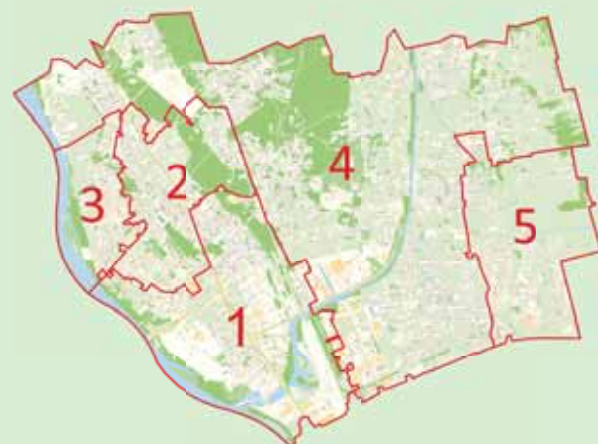
Dzielnica Białołęka - podział na okręgi wyborcze

klub: Koalicja Obywatelska komisje: Sportu, Rekreacji i Turystyki; Zdrowia kontakt: gszustek@radny.um.warszawa.pl, tel. 22 443 05 83